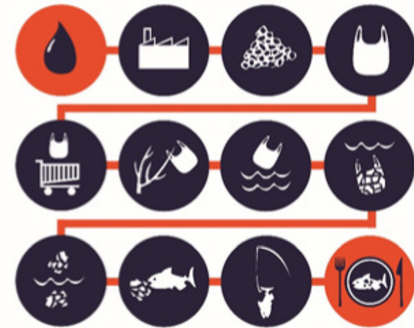
CYCLE DE VIE DU SAC PLASTIQUE, DE LA GOUTTE DE PÉTROLE À VOTRE ASSIETTE.

Les sacs en plastique s'ajoutent à la longue liste des déchets en plastique qui, selon certains experts, seront plus nombreux que les poissons dans l'océan en 2050 ! Les sacs plastique ont donc des effets désastreux pour l'environnement, et en particulier le milieu aquatique. Ils sont notamment responsables de la mort de plus de 260 espèces marines différentes. Ils sont également potentiellement dangereux pour la santé humaine : les mêmes poissons qui ingèrent des sacs plastique finissent dans nos assiettes.